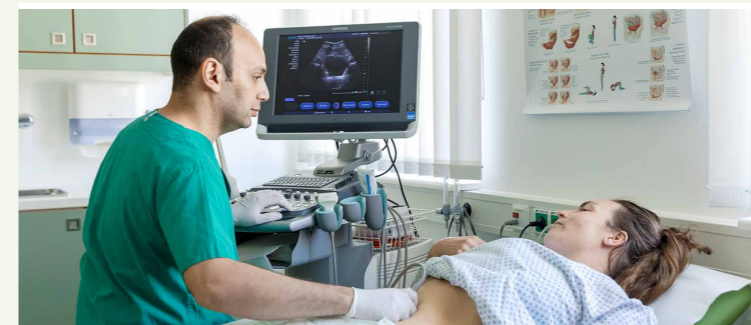
Sonographie auf den QZ-Stationen und in der QZ-Ambulanz