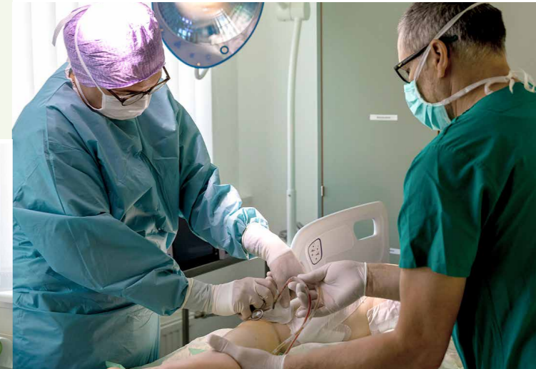
Konservatives und operatives Wundmanagement