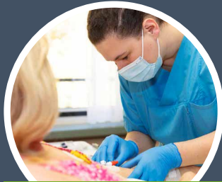
Pflegefachkraft & Krankenpflegehilfe

PROBIER DICH AUS, WAS AM BESTEN ZU DIR PASST: