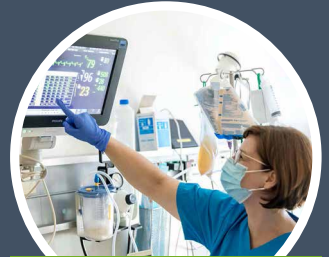
Medizinische Technologen für Funktionsdiagnostik

WIR SUCHEN DICH ... denn bei uns bist du an der richtigen Adresse!