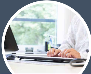
Kaufleute im Gesundheitswesen